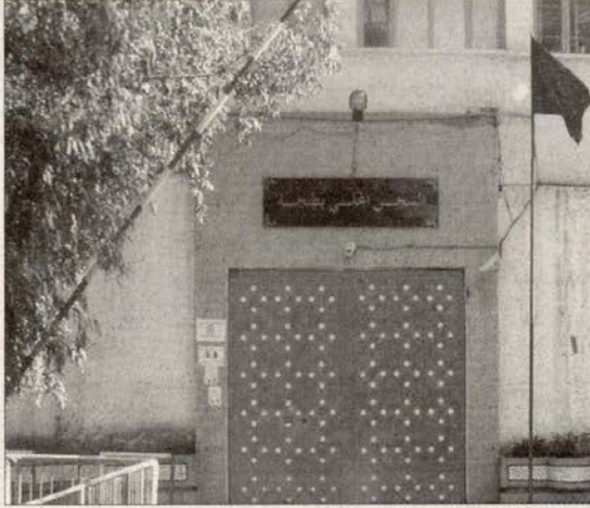
السجن المدني (سات فيلاج) بطنجة (خاص)

ذاته أنه تم التطرق إلى مجموعة من «الانتحارات» التي عرفها سجن سات فيلاج «طنجة»، والتي بلغت أكثر من ثلاث حالات في ظرف لا يتجاوز الشهرين، وهي لمعتقلين كانوا قيد حياتهم مدانين في جرائم تتعلق جلها بالمخدرات، وحسب النزلاء فإنه يتم التستر عن الأسباب الكاملة التي دفعت السجناء إلى الانتحار؟، ولعل الحادثة التي عرفها سجن طنجة في منتصف شهر مارس الماضي طرحت أكثر من علامات استفهام، بعدما أقدم سجين مدان ب (30 سنة) سجنًا من أجل جريمة قتل على محاولة الانتحار مرتين، إذ في المرة الأخيرة تم إنقاذه من الموت من طرف موظفي السجن، وفي كل عملية انتحار كان السجناء يعلقون أنفسهم بحبال ويعتدي على ذاتهم بالأدوات الجارحة، فكيف تسربت الحبال والأدوات الجارحة إلى داخل زنزانات هذا السجن؟، وأين هي المراقبة؟ أسئلة حيرت بعض الجمعيات الحقوقية.