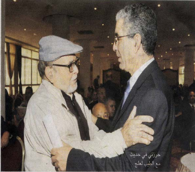
حرزني في حديث مع الطيب لعلج