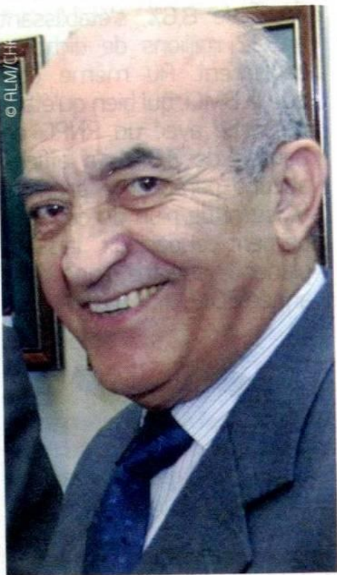
Abderrahman Youssoufi Ancien Premier ministre