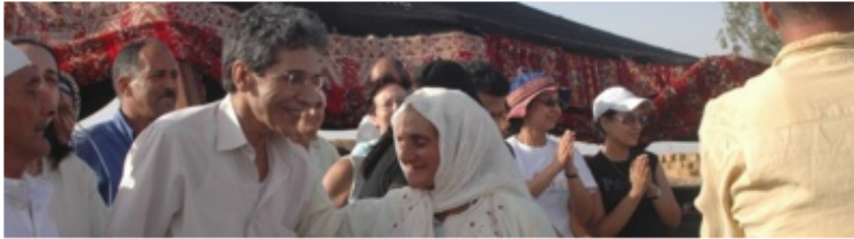
الراحل إدريس بزمكري، رئيس هيئة الانتصاف والمصالحة

"عن "الأخبار" و"المساء" الاثنين 11 فبراير 2013 - 21:00