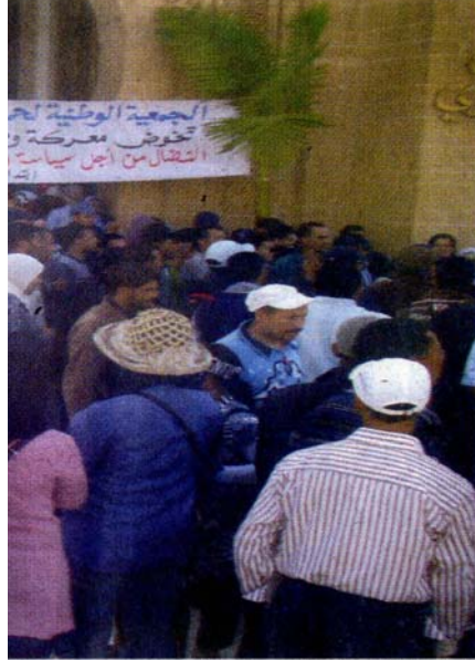
المعطلون أثناء اقتحامهم مقر المجلس

القانون والمنافية لممارسة الحريات والتمتع بالحقوق» مشيرا إلى أنه لم يسبق له أن تلقى أي طلب لقاء مع مسؤوليه من قبل الجمعية المذكورة، خاصة أن المطالب التي رفعها المعطلون للمجلس لا «تندرج بشكل