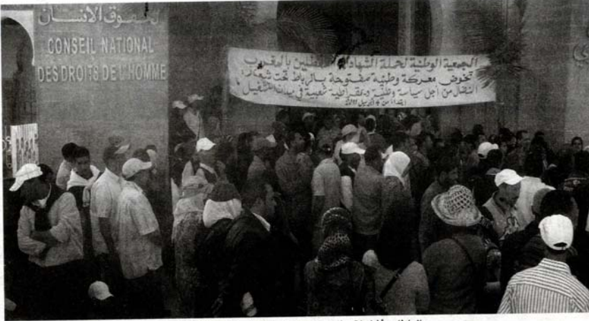
العاطلون أثناء اقتحامهم لمقر المجلس الوطني لحقوق الإنسان