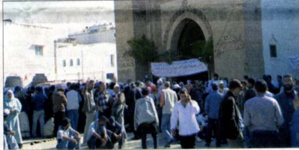
مجموعة من العاطلين أمام مقر المجلس الوطني لحقوق الإنسان بالرباط (خاص)

وأكد المجلس أنه لم يسبق له أن تلقى أي طلب لقاء مع مسؤوليه من قبل جمعية العاطلين، وأن النقاط الواردة في ملفهم المطلي لا تندرج بشكل مباشر في اختصاصات المجلس، مشيراً إلى حرصه على متابعة ملفهم مع الجهات المختصة. وعبر المجلس عن رفضه الخضوع لأي شكل من أشكال الإبتزاز، والأفعال الخارجة عن القانون، والمنافية لممارسة الحريات والتمتع بالحقوق.