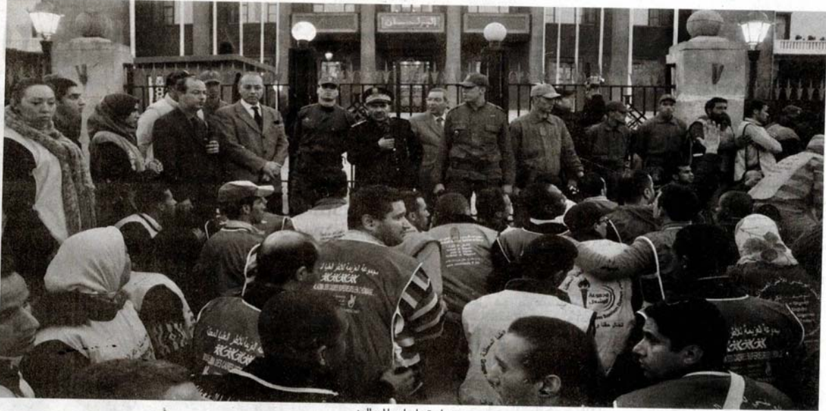
من احتجاجات المعطلين