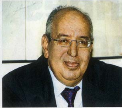
▲ DEUX PASSIONS : la défense des droits humains et la réforme de l'éducation.

Emprisonné au début des années 1970 – il était l'un des fondateurs de l'extrême gauche –, il rompt très vite avec le dogmatisme de cette première école politique sans renoncer pour autant à son idéal démocratique. C'est