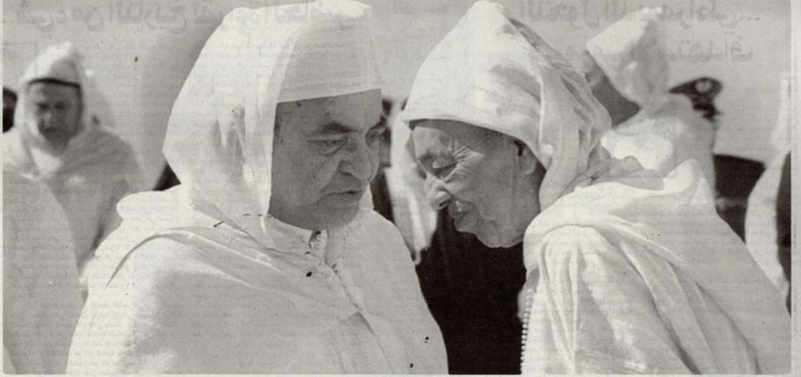
الراحل الحسن الثاني في حديث إلى وزيره الأول آنذاك عبد الرحمن اليوسفي